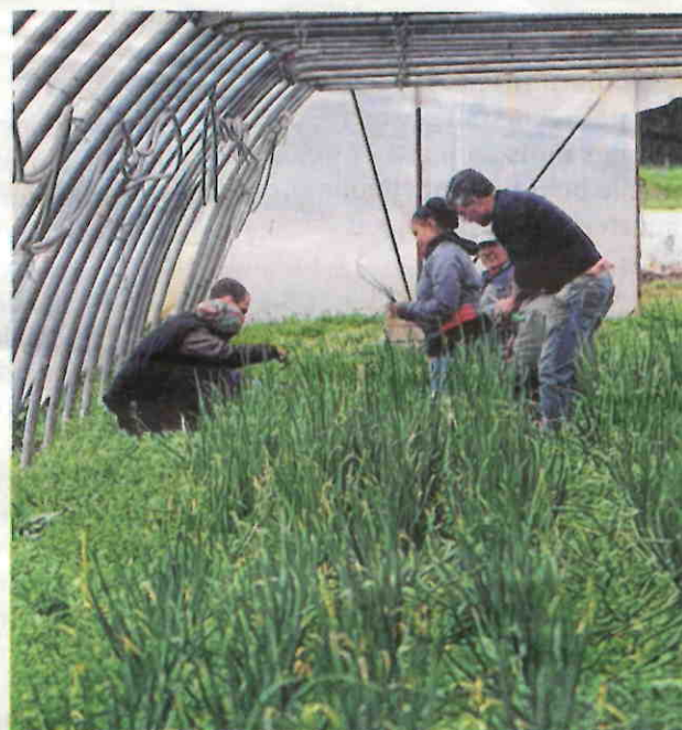
À partir de 2020, la CIAP portera le stage paysan créatif, aujourd'hui géré par les Adear. Un dispositif qui permet d'évaluer un projet avant l'entrée en CIAP.